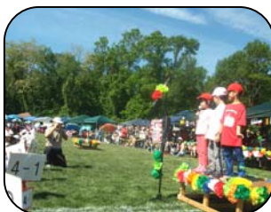
<かわいい選手宣誓>

今年の運動会は清々しい青空の下で、雨の心配もなく、予定通り開催することができました。