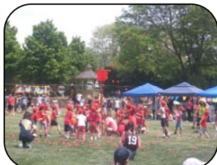
<1・2年国際学級:玉入れ>