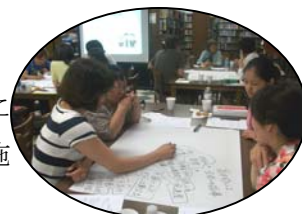
<教職員研修の様子>

NJ補習授業校においても全教職員が予防と対応策を身につけることを目的に研修を実施致しました。